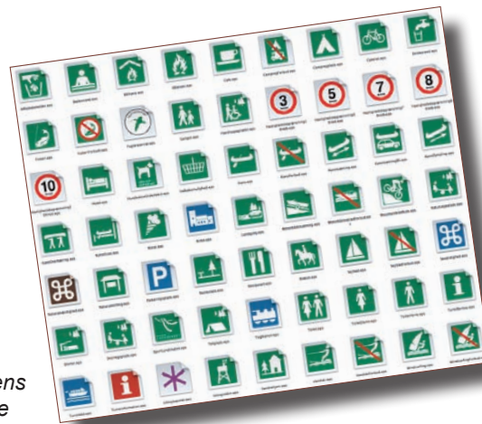
Naturstyrelsens piktogramlinie bør suppleres

Det er vigtigt at designe QR-koden, så publikum ved, hvad man kan forvente, hvis man scanner.