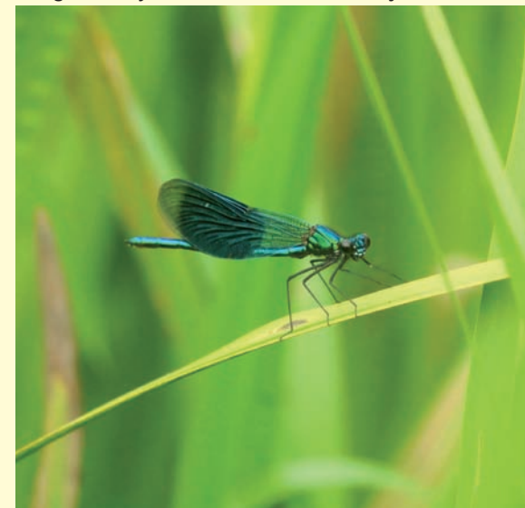
Pragtvandnymfe, Trækstien ved Vejerslev Skov