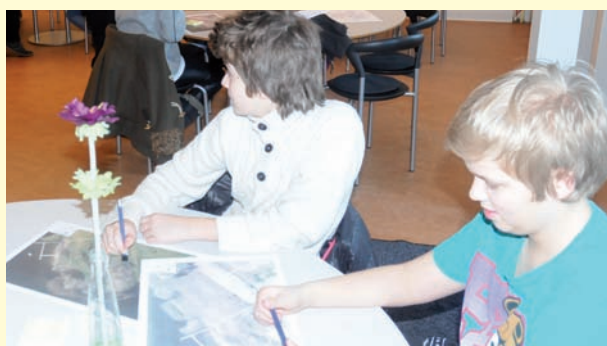
Workshop om indretning af Sdr. Ege Strand ved Ry – børn fra skoler og idrætsklubber