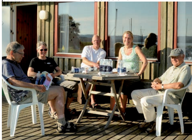
Partnerskabsmøde on location – hos Ry Sejlklub, partnerskabet om Knudhule Strand.

Partnerskabet skal opnå konsensus om et projektforslag – det vil sige, at ikke alle partnerskabets deltagere får alle deres idéer gennemført. Det er derfor også vigtigt som indgang til arbejdet, at man er enige om, at det er et vilkår for et frugtbart samarbejde, at kompromisser skal indgås.