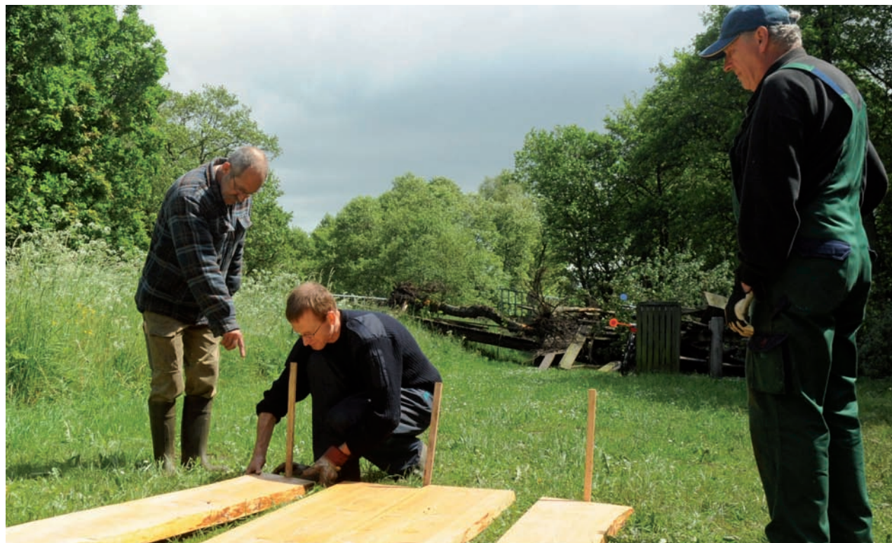
Naturstyrelsens tømrer vejleder de frivillige fra Gl. Rye Borgerforening om opsætning af borde/bænke-sæt.

Ingen kæde er stærkere end det svageste led, så der er gode erfaringer med brug af veletablerede foreninger og blandede erfaringer med foreninger, hvor medlemskommunikationen ikke er solidt forankret i forvejen. Successen står og falder lidt med foreningens egen evne til at kommunikere med medlemmerne samt talsmandens mulighed for at indgå i det frivillige arbejde.