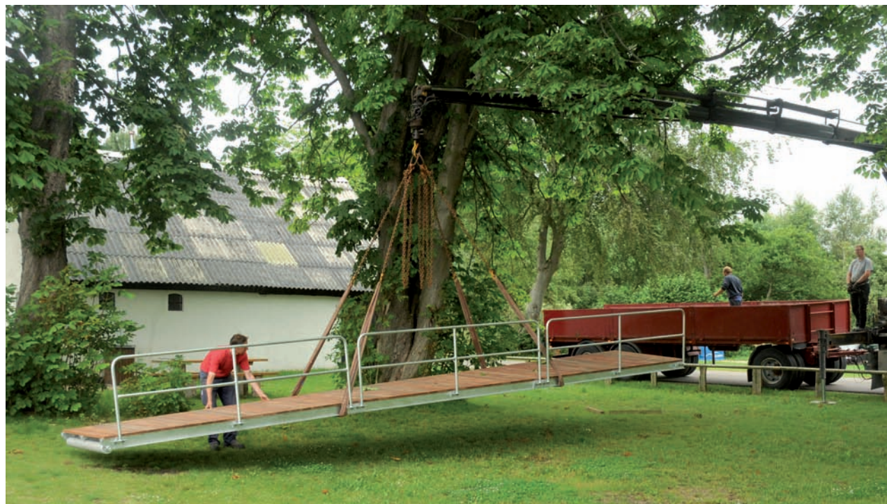
Handicaprampe til Vædebro – visse opgaver skal udføres professionelt