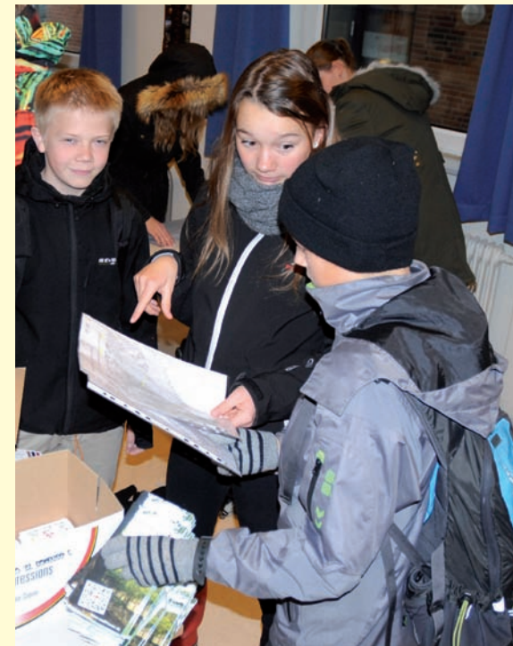
Mølleskolens 8. D husstandsomdeler folderen om StoRYturen og tjener lidt til lejrskolen