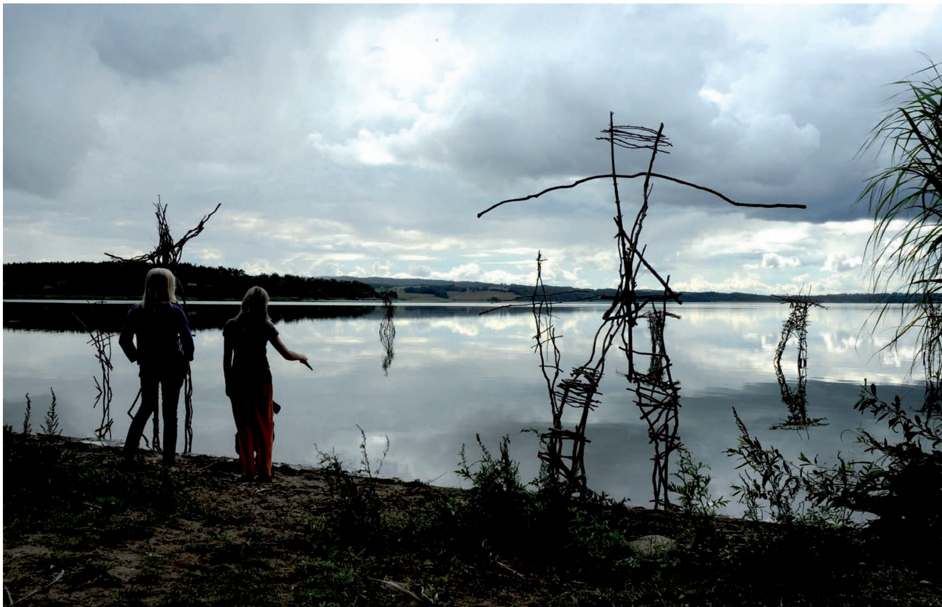
Fra Kulturring Østjyllands event "find en kunstner" som fandt sted i rammerne fra det grønne partnerskab ved Vædebro