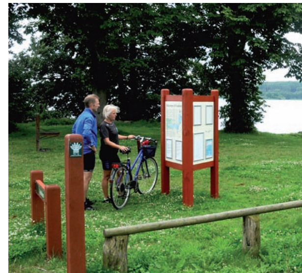
Gæster ved Vædebro

Omvendt er det vigtigt, at myndighederne er skarpe og præcise, for når man som frivillige partnere har brugt tid på at udarbejde en flot projektbeskrivelse – som endda inden indsendelsen til Naturstyrelsen har været igennem kommunens grønne råd – så kan det virke demotiverende, hvis myndighedsbehandlingen bliver unødigt langtrukket, eller at bureaukratiske detaljer udskyder det samlede projekt på ubestemt tid.