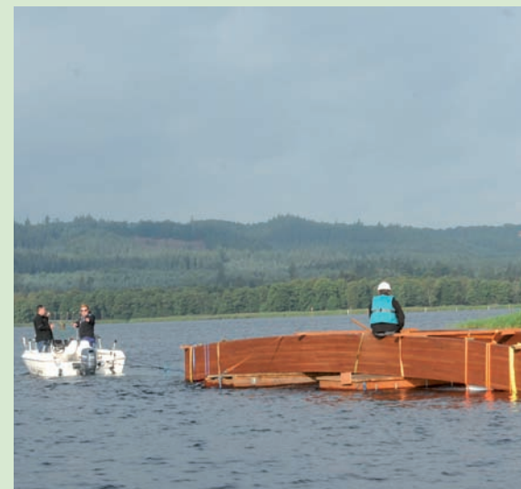
Bro-elementer ad søvejen

Stien vil øge tilgængeligheden til naturen – bl.a. ved kobling med togforbindelsen Ry-Silkeborg og en færge over søerne til stinettene syd for søerne samt etablering af en stibro ved Marimunde, hvor publikum ikke har adgang i dag.