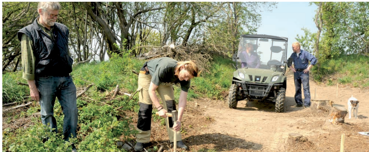
Naturstyrelsens tømrer kan også vejlede de frivillige fra Ejer Bavnehøjs Venner på den privatejede Møgelhøj

Omkring finansieringen vil det være en god idé, hvis kommunen tilbyder sig som økonomi-administrator. Derved kan kommunen bidrage til projektet ved afløftning af moms i forhold til offentlige midler og midler, der sidestilles med offentlige midler – f.eks. tips- og lottomidler. På den måde får partnerskabet mest ud af sine tilskudsmidler.