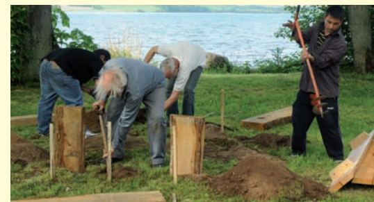
Alken Borger- og Aktivitetsforening etablerede en lørdag bl.a. borde/bænke-sæt med riste til engangsgrills ved Vædebro.

Det indebærer f.eks. også, at en del af aktiviteterne kan foregå uden for alm. arbejdstid.